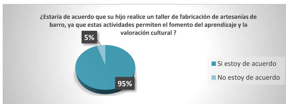
Figura 2. Resultado de encuesta.

De acuerdo a las encuestas realizadas (figuras 2 y 3) a los padres de familia el 47% de los niños se encuentran en edades de 7 y 8 años lo cual es un segmento determinante en vista de que esa edad les permitirá un manejo más fácil de los elementos necesarios para el moldeado de la arcilla, el 65% de los padres de familia considera muy relevante que sus hijos puedan participar de actividades creativas a partir del turismo en talleres artesanales pues esto sería una estrategia de aprendizaje significativo en sus hijos, les permitirá iniciar su vida como viajeros y hacer del turismo y la experiencia una forma de aprendizaje. De igual manera, el 92% de los padres encuestados manifiesta que salen de viaje regularmente y llevan a sus hijos, esto significa que el turismo es una práctica recurrente para la mayoría, por lo tanto, esta propuesta tiene todas las posibilidades de ser llevada a cabo. El 95% de ellos considera estar de acuerdo en que sus hijos participen en talleres experienciales en el marco de las salidas turísticas de sus instituciones, pues consideran esas actividades como algo complementario que es muy importante en su proceso de formación académica.